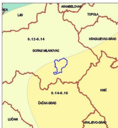
План детаљне регулације „Кружна раскрсница-занатски центар“ – нацрт плана