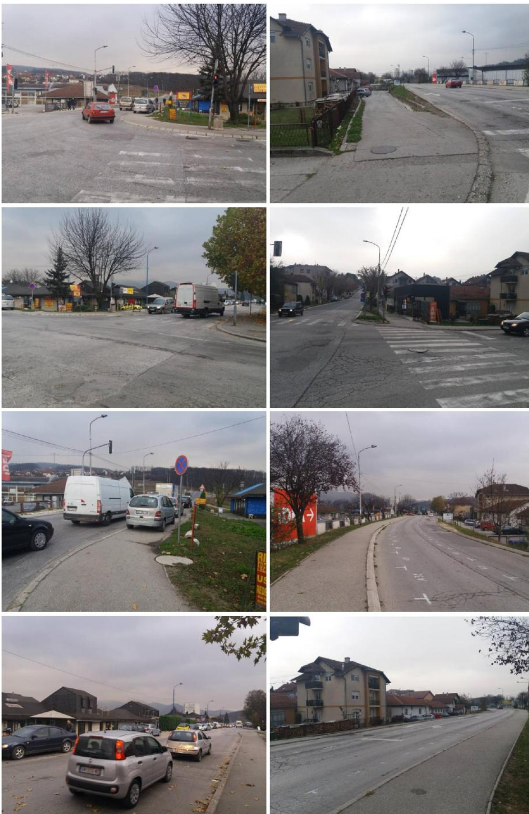
План детаљне регулације „Кружна раскрсница-занатски центар“ – нацрт плана