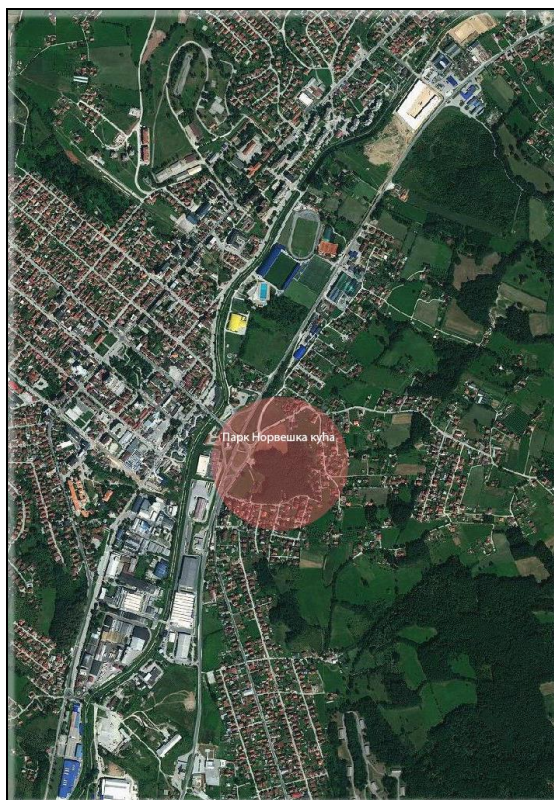
Слика бр. 1: Приказ ширег окружења

Комплексу ресторана „Српско-Норвешког пријатељства“ се приступа преко ул. Николе Милићевића Луњевице са севрозападне стране и преко ул. Петра Кочића са јужне стране. У јавној зони комплекса изграђени су паркинг простор за посетиоце /до 20 паркинг места/ и паркинг за запослене на делу парцеле у близини објекта где је економски улаз. У непосредној близини ресторана на јужном делу комплекса је такође изграђен пратећи приземни објект који није у функцији. Већи проценат парцеле је покривен густом шумом у којој је присутан на југо-источном делу и објект за становање /П+1/ који треба јасно одвојити од разраде и уређења простора.