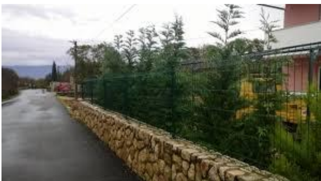
Пример ограде комплекса