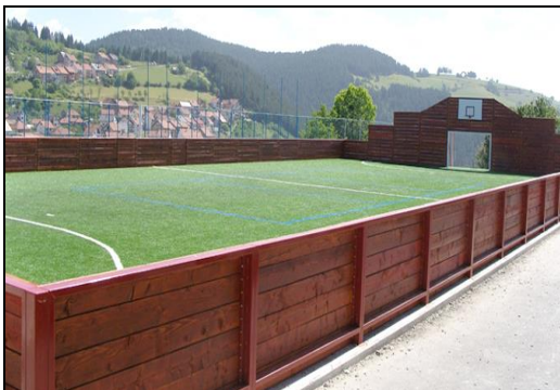
Пример терена за мини пич

У зимском периоду када се терен користи као клизалиште, опрема за прављење леда као и сва потребна инсталација се поставља унутар терена. Уместо правог леда, може се користити синтетички лед који се лако демонтира на пролеће.