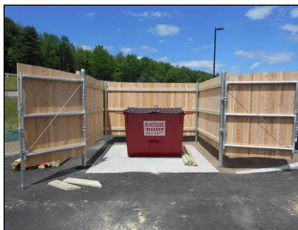
Пример одлагања смеђа