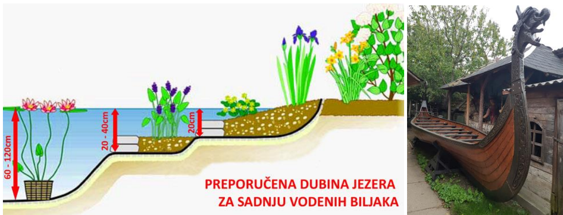
Бр.9 – Пример вештачког језера са аждајом и пример норвешке барке