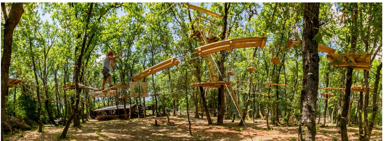
Бр.2 – Пример zip line полигона и полигона са спаравама и мрежом