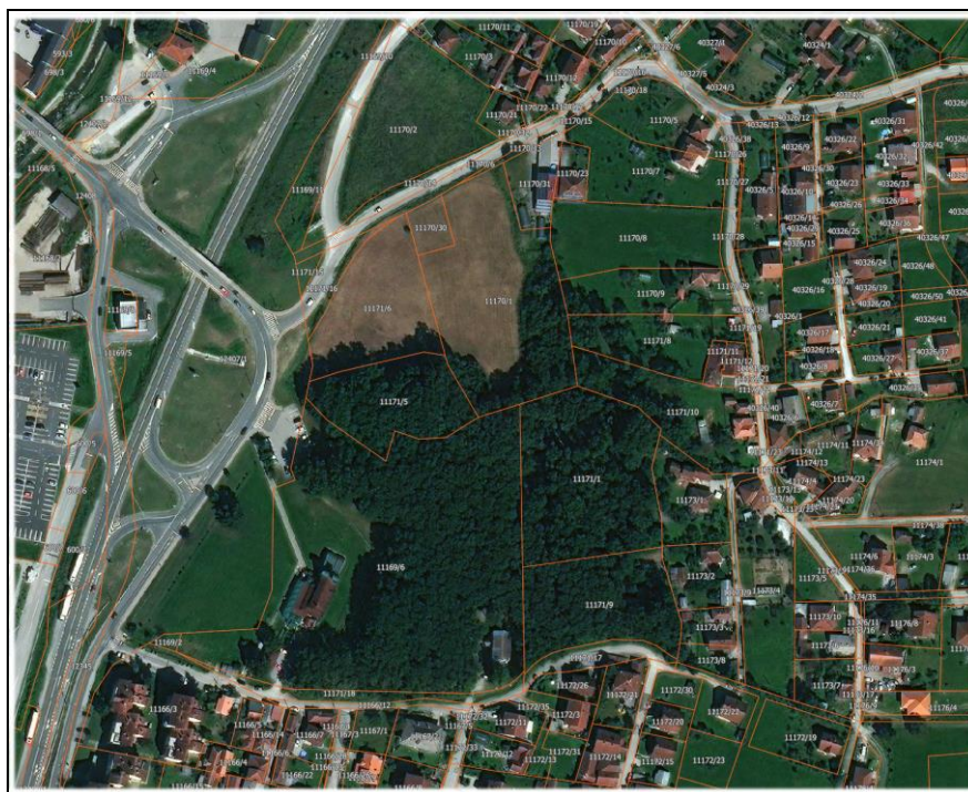
Слика бр. 2: Ортофото са приказом предметне локације