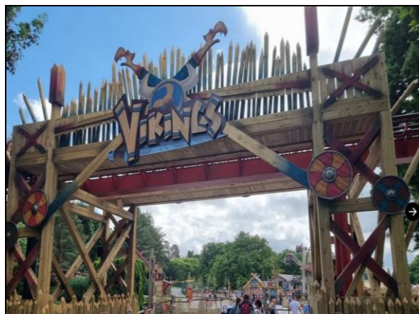
Бр.1 – Пример капије авантура парка