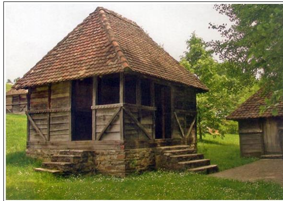
Бр.3 – Пример дрвених кућа у викиншком и српском стилу